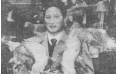
作者在日本某公园参观

日本政府很重视自然保护区的建设，东京港野鸟公园，以保护水鸟水禽为主，是战后由政府投资300亿日元填海造陆而建成的，单工程建筑就用了31亿日元。福冈县的出水鹤类保护区，是政府年出资200万日元租用的私人土地，专供