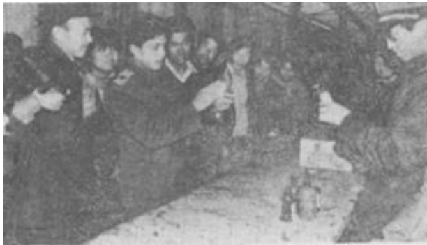
垦利县工商局，组织了30人的农资检查假治劣小分队，对60多家销售点进行了检查、清理。图为工商人员在向农民介绍识别假农药的方法。

利津讯 利津县店子乡强化农业的基础地位，优化产业结构，发挥优势抓龙头，盯住市场奔富路，发展一村一品、一地一业的多种经营、在全乡建成了七大生产基地。去年，该乡工农业总产值达到5600万元，人均收入623元。该乡审时度势，在稳定粮棉生产的同时，大力发展多种经营。他们围绕市场上规模求效益，一是建立起了以陈家村为龙头的万亩小麦良种生产繁育基地，使全乡增产小麦75万公斤，并成为山农大的第二个小麦良种繁育基地；二是完善以殷家村为龙头的的苇、柳、草“三编”生产创汇基地，全乡3000多个家庭创汇小工厂常年不停，年出口创汇额达56万美元；三是建立以双高村为龙头的3000亩经济林果生产基地；四是建立起以西朱村为龙头的畜牧生产基地，全乡利用青贮氨化饲料饲养肉食牛2000多头，肉食兔8000多只，肉食鸡35000多只，实现产值350万元；五是建立起了以西李村为龙头的100亩塑料大棚蔬菜生产基地，实现年产值25万元；六是建立了以乡东四村为龙头的1000亩淡水养鱼生产基地，年创产值达400万元；七是建立起了以西孙村为龙头的油料加工生产基地，全乡80台榨油机年加工大豆、花生13000吨，创产值800万元。(志忠 树平)